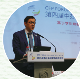
◎芬中教育协会主席 亚力·安德森