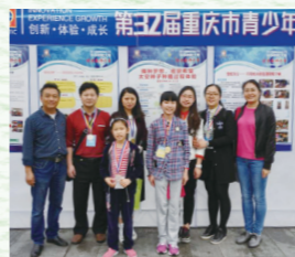
◎参加32届青少年科技创新大赛