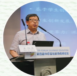
◎北京师范大学教育学部部长 朱旭东