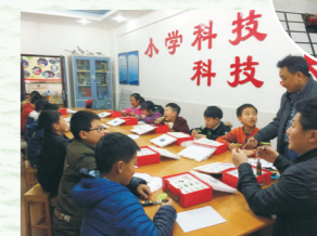
◎科技兴趣小组正在学习