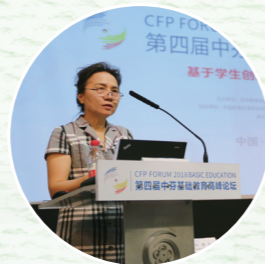
◎重庆市教育学会会长 钟燕