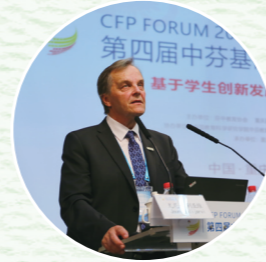
◎PISA考试芬兰国家总负责人 尤尼·瓦利亚维