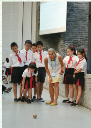
◎芬兰教师与学生一同做实验