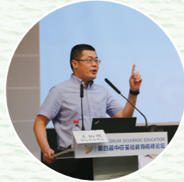
◎教育部教师司综合处处长 王炳明

2018年6月27日至28日，第四届中芬基础教育高峰论坛在重庆市谢家湾小学举行，中芬教育专家及全国各省市一线教师近千人参会，共同聚焦“基于学生创新发展的课堂变革力”。