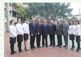
◎锐意进取的领导班子

光阴荏苒，梓潼小学通过科技教育这个突破点，不仅提升了全体师生的科学认知，还切实推进了学校其他工作的大步前进！我们还将沿着这条道路，继续前行，把梓潼小学的科技特色打造得更加亮丽，让学校发展得更快更好！