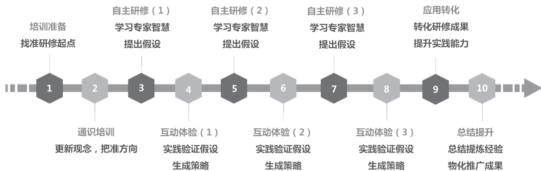
AEA国培模式实施流程