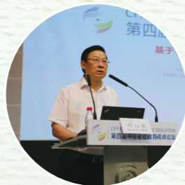
◎重庆市教委专职督学 邓沁泉