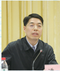
◎重庆市社科联副主席 潘勇