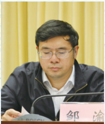
◎重庆市教育学会副会长、重庆第二师范学院书记 邹渝