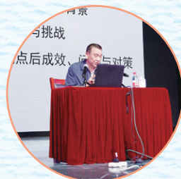
◎中国教育学会常务副会长 戴家干