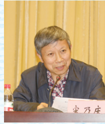
◎重庆市教育学会学术委员会主任委员、教育部西南基础教育课程研究中心主任 宋乃庆