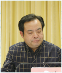
◎重庆市民政局民间管理局局长 肖伟