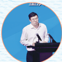
◎重庆市教育学会副会长、重庆第二师范学院党委书记 邹渝