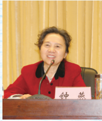
◎中国教育学会副会长、重庆市教育学会会长 钟燕