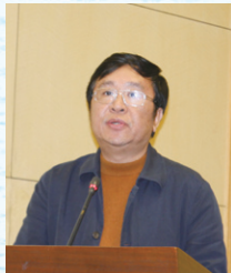
◎重庆市教育学会副会长、重庆市教科院院长 徐辉