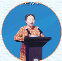
◎中国教育学会副会长、重庆市教育学会会长 钟燕